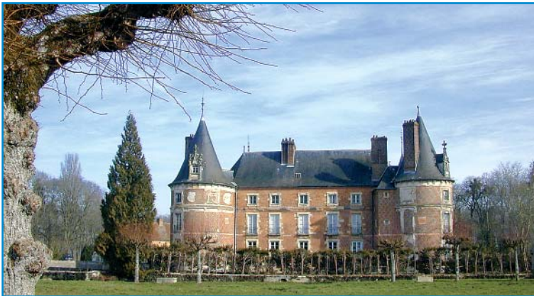
Schloss Longecourt stammt ursprünglich aus dem 12. Jh.