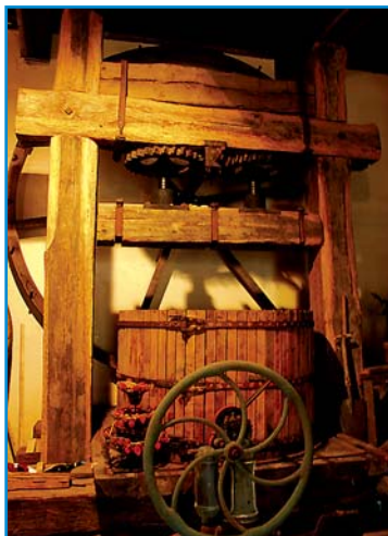
Wein aus Epineuil hat Tradition.

So wurde er unter anderem bei den Fundamentierungen des Eiffelturms eingesetzt, aber auch beim Rathaus und beim Panthéon in Paris. Wegen seiner Farbe und seiner Qualitäten findet er auch heute noch Verwendung, beispielsweise beim Flughafen von Pyad oder beim Metropolitan Museum in New York – der Transport dorthin erfolgte allerdings nicht mit Pénichen.