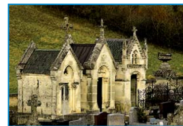
Der berührende Friedhof in Epineuil.

Es besteht praktisch nur aus zwei Straßen: die Hauptstraße geradeaus hinauf zur Kirche, und eine schräg links, die weiter oben wieder in die Hauptstraße mündet.