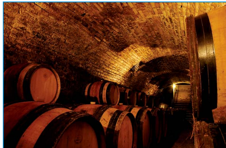
Domaine de l'Abbaye du Petit Quincey: Verkostung und Lieferung zum Boot.

Am LU, 1 km vom Kanal landeinwärts und stets ein wenig bergauf, liegt der Weinort Epineuil (am besten vom Kreisverkehr bei Schleuse